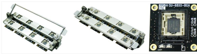
Socket Actuator + Press Bar SU-68xx-BGA

★ Adaptador tipo pin Pogo: 4 tipos de encapsulamentos 11.5x13 ,12x16, 12x18, 14x18mm. São substituíveis de acordo a necessidade do cliente.